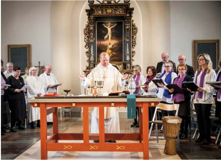
Ett nytt altare är kyrkans centrum.

– Det här blev precis så bra som vi hade kunnat önska, säger