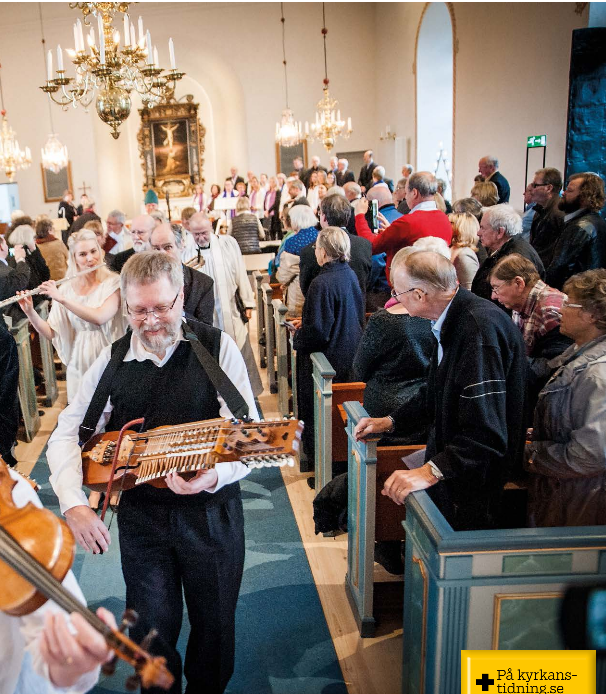
stämningen vid återinvigningen.

✚ På kyrkans-tidning.se finns film från invigningen.