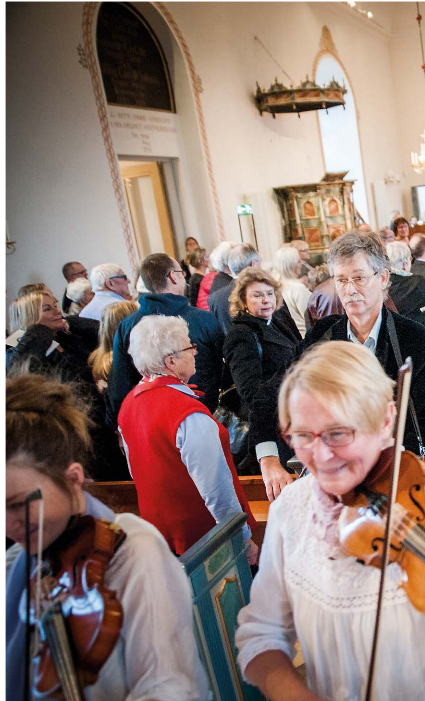
Rådmanö spelmanslag och Skärgårdskören bidrog till den glada

Han inser svårigheterna att göra om medeltida kyrkor men hoppas att lösningen i Rådmanö kan bli en modell för andra församlingar.